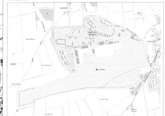
Übersichtskarte o. M. Geodatenformat: T: Bayerische Vermessungsverwaltung 2024

ZWECKVERBAND area61 INNOVATIONSPUNKT PENZING - LANDSBERG AM LECH