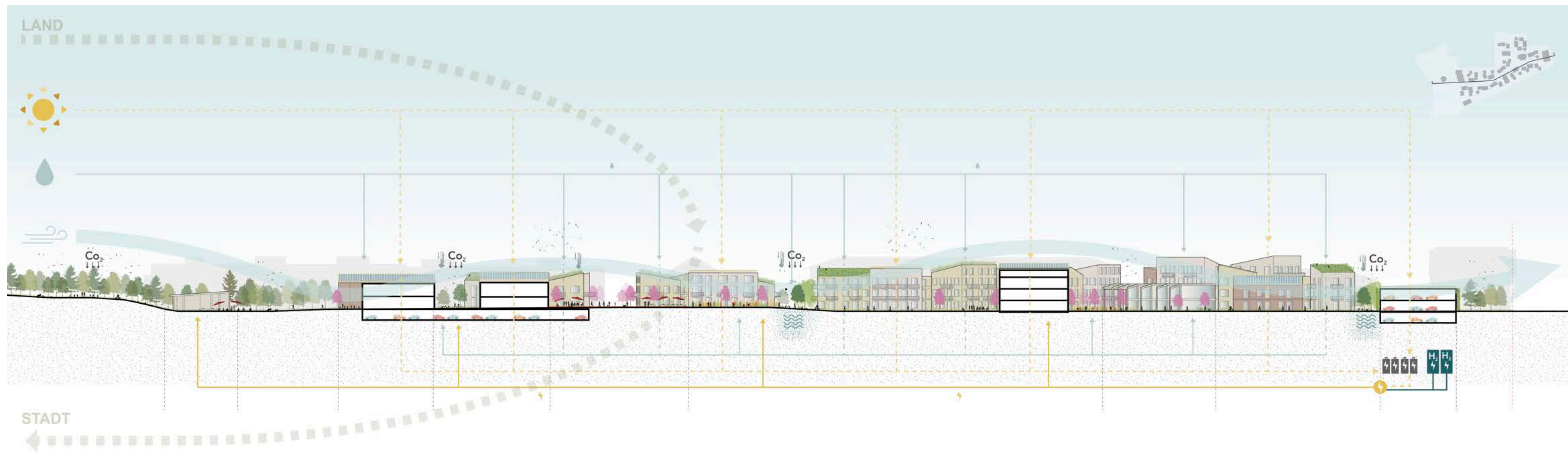
SNITT A - A' M 1:500